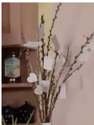
Juditék Családi Fája