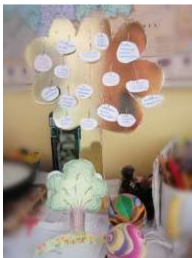
Orsinak és a kislányának a Fája