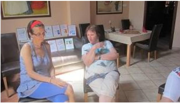
gondolkodtunk a feladaton,...