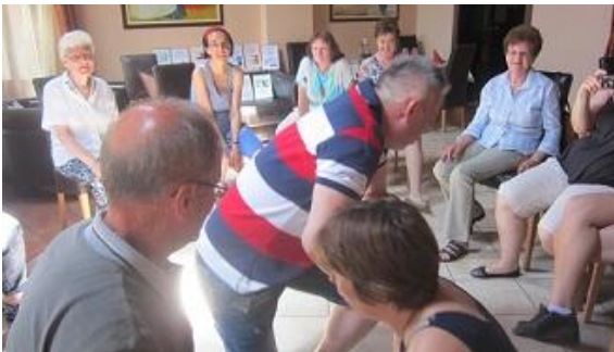
végül az eredmény egyik csapatnál sem maradt el, mert...