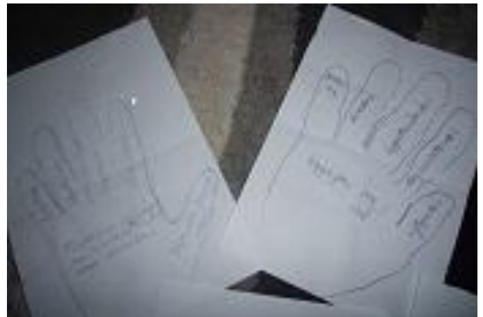
a lelkesedéssel megjelenik az EGYSÉG, amiben ERŐ van!