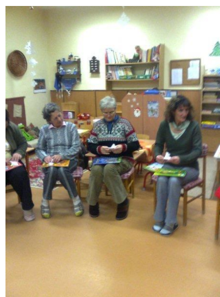
Már a többiek is pedzik...