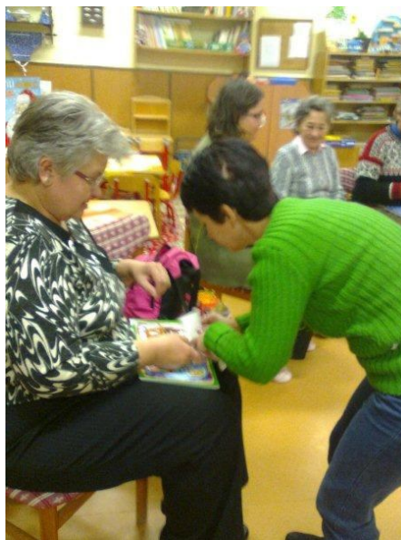
Látod Márti, ezt oda...