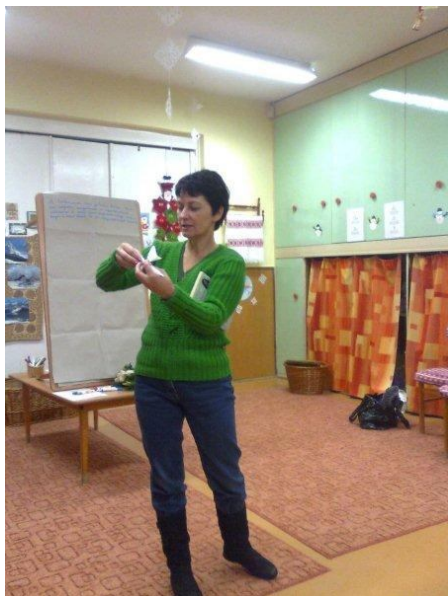
Így kezdjétek a hajtogatást...