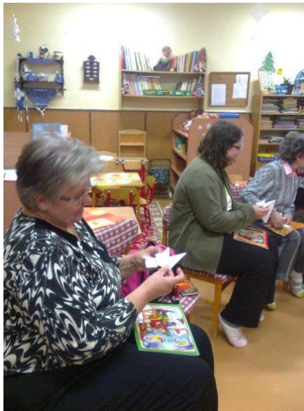
Sikerült, és milyen szép lett!