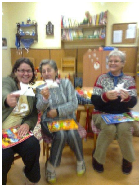
Így már jó?