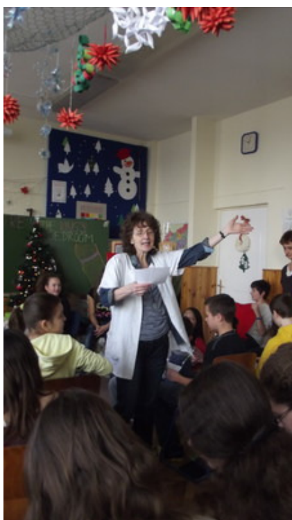
A történetet megismerjük.

A próbák (szakköri foglalkozások) valahogy így zajlanak: