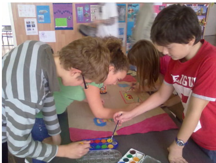
Majd fontos momentum, a díszletek kitalálása és elkészítése is.

A kerületi tehetségnapon (2012. november 13.) a szakkör bemutató foglalkozásán az érdeklődők a tehetségfejlesztő feladatok mellett a „Király reggelije” című készülő darab próbáját is figyelemmel kísérhették.