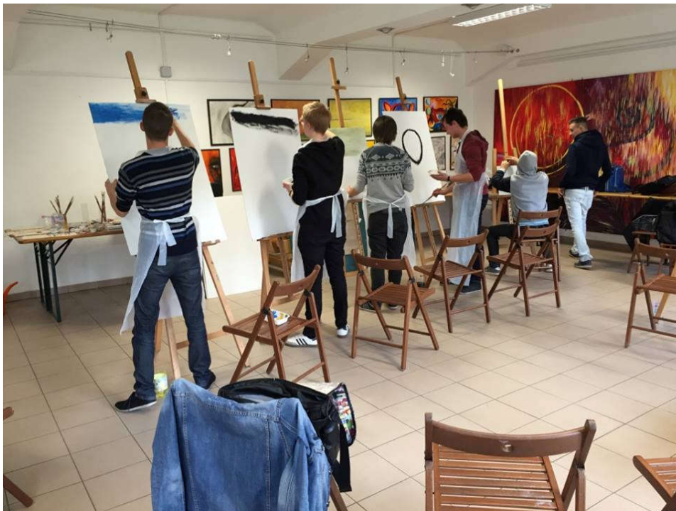
A művészet, mint terápia a Moravcsik Alapítványnál.

Isten hangja is ott lebegett úgy tudom Ahogy a félálom mezsgyéjén játszadoztam és elmagyarázta nekem Az életem. „Akit vonz a sötétség Biztos lehetsz benne Hogy egykoron erős fény Bántotta a szemét”